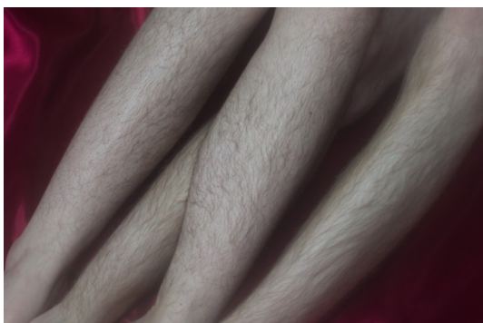
hair has no gender // Fotowettbewerb vh

Kurzum: Das Jahr hat mich nicht nur um Wissen und Menschen bereichert, sondern hat auch zu meiner Selbstentfaltung beigetragen. Und das alles wäre ohne die Unterstützung der Stiftung Gänseblümchen nicht möglich gewesen und ich bin dankbar, dass ich die Chance bekommen habe, diese Erfahrungen zu machen.