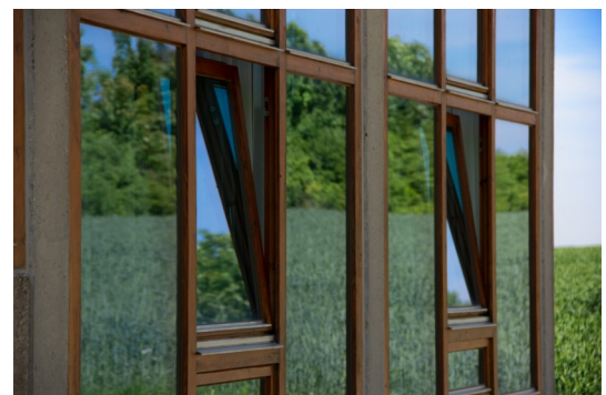
Hochschule für Gestaltung